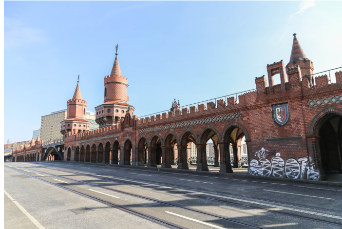
Blick auf die Spree